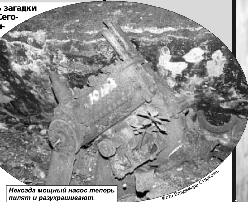
Некогда мощный насос теперь пылит и разукрашивается.

С левой стороны зияет пролом в стене, по краям которого видны следы от автоматных выстрелов. «Наверное, здесь была проходная...» — предполагает диггер. Судя по толщине кирпичной кладки, на петлях висели мощнейшие двери, способные выдержать любой натиск. Из пола торчат погнутые железные палки, скорее всего на них крепился стол, где, само собой, лежал журнал, в котором фиксировали всех посетителей станции. Но