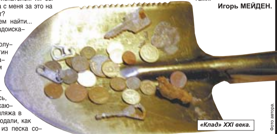
«Клад» XXI века.