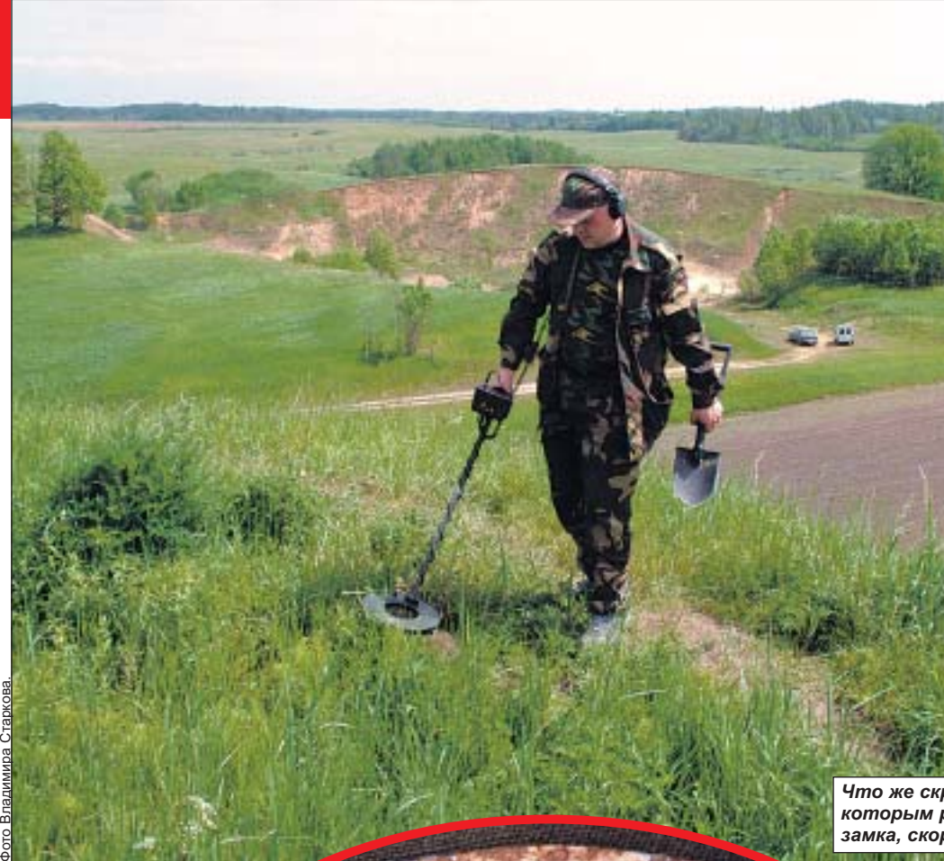
Что же скрыто в холме, под которым развалины древнего замка, скоро станет ясно.

Однако вдруг Константин как бы проронус и, взглядевшись в дорогу, аж вздрогнул. Впереди — поле, но уж больно странное. По краям стояли