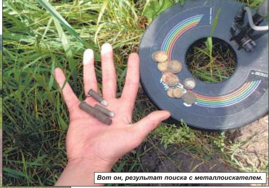
Вот он, результат поиска с металлоискателем.